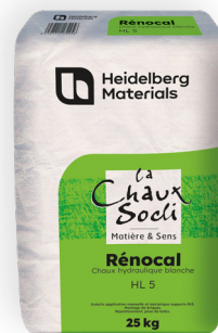
Chaux formulée à base de chaux hydraulique naturelle, ciment blanc et agents d'onctuosité

Les+ Adjuvantation spécifique pour le passage en machine