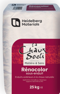
Rénocolor sous-enduit (sous-couche)