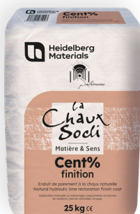
Cent% finition (12 teintes du nuancier avec couleur issue du sable naturel)

Les+ Nuancier 32 teintes dont 12 naturellement teintées par le sable. Compatible support tendre