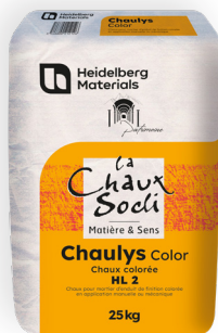
Chaux naturelle colorée formulée, pour passage machine ( finition)

Les+ Nuancier 12 teintes et gain de temps sur chantier