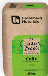
Chaux formulée à base de chaux hydraulique naturelle, ciment gris et agents d'onctuosité