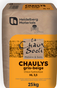
Chaux naturelle beige formulée, pour passage machine (sous-couche)