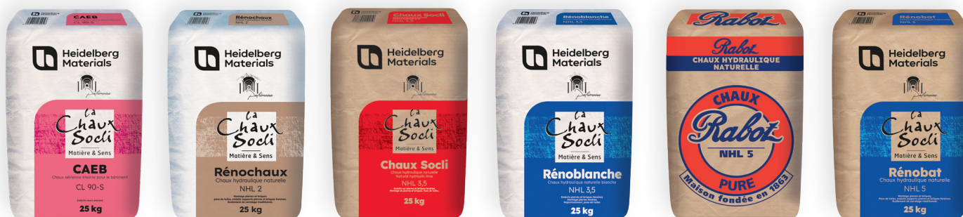
Chaux aérienne CL 90