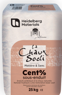
Cent% sous enduit (sous couche)